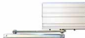
MH Auto (automatisch) MH Auto kann auch lackiert werden in der gleichen Farbe wie der Schaft.