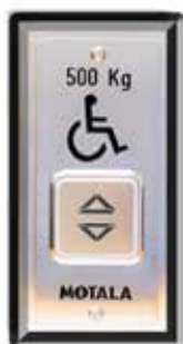
Anruftasten in einer externen Box