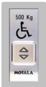
Anruftasten in der Wand